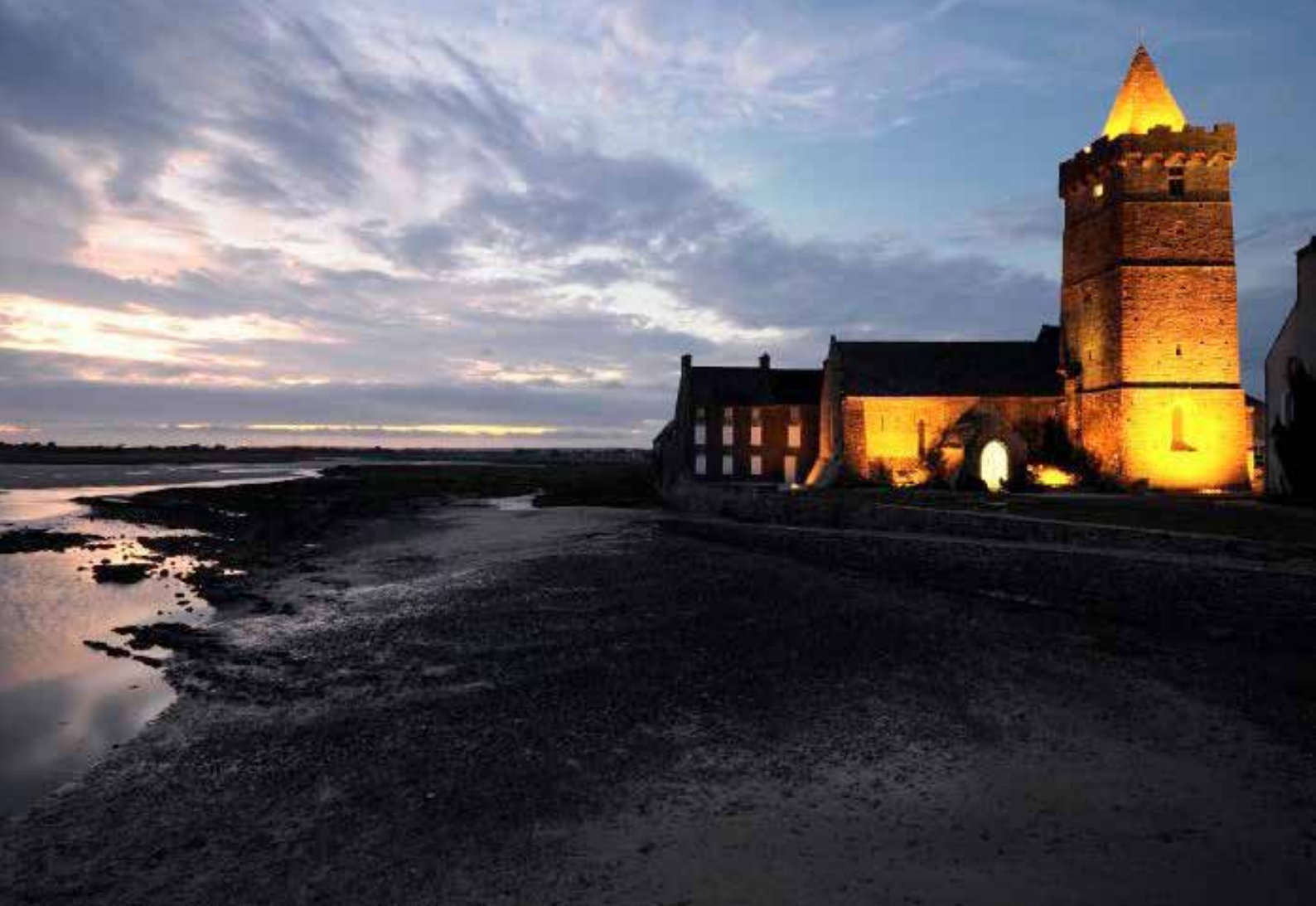
Portbail, côte ouest du Cotentin

certaines théories de « sacralisation », de « patrimonialisation » élaborées et véhiculées depuis le milieu du XIXe siècle.