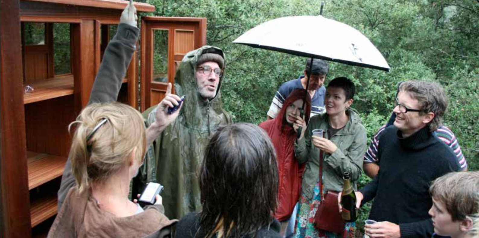
Vernissage de l'armoire de « Revolution is not a picnic »

blic et espace privé et l'ensemble du paysage constitue l'environnement de tous, un capital commun partagé sur lequel chacun agit sous le regard des autres. Ainsi, est née cette évidence que le paysage des territoires de pente constitue dans sa totalité un espace collectif, certes au foncier privatisé, mais dont l'imaginaire symbolique renvoie à la communauté tout entière.